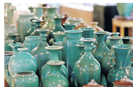
黔东南州平塘县牙舟镇牙舟陶。