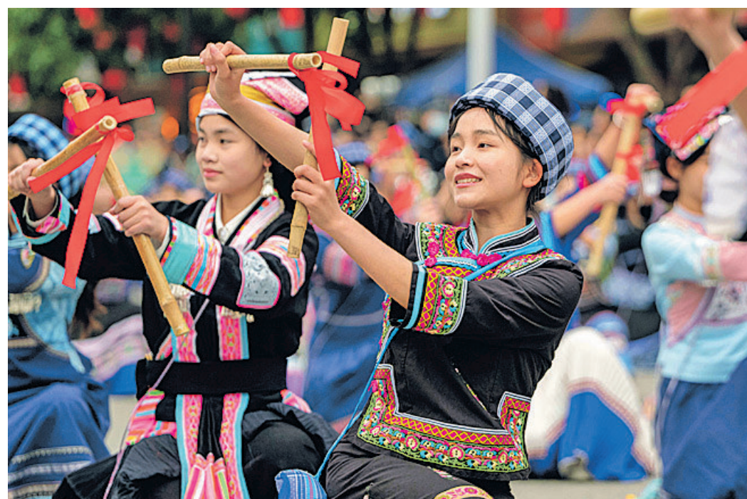
黔东南州望谟县传统节日“三月三”。

当万千游客走进寨门时，拦门酒与山歌如潮水般涌来，远方之客不再是旁观者，而是这场天地人和盛宴的共创者。一节一庆之间，贵州各族群众与来自五湖四海的宾客共舞同欢，不断构筑中华民族共有精神家园。