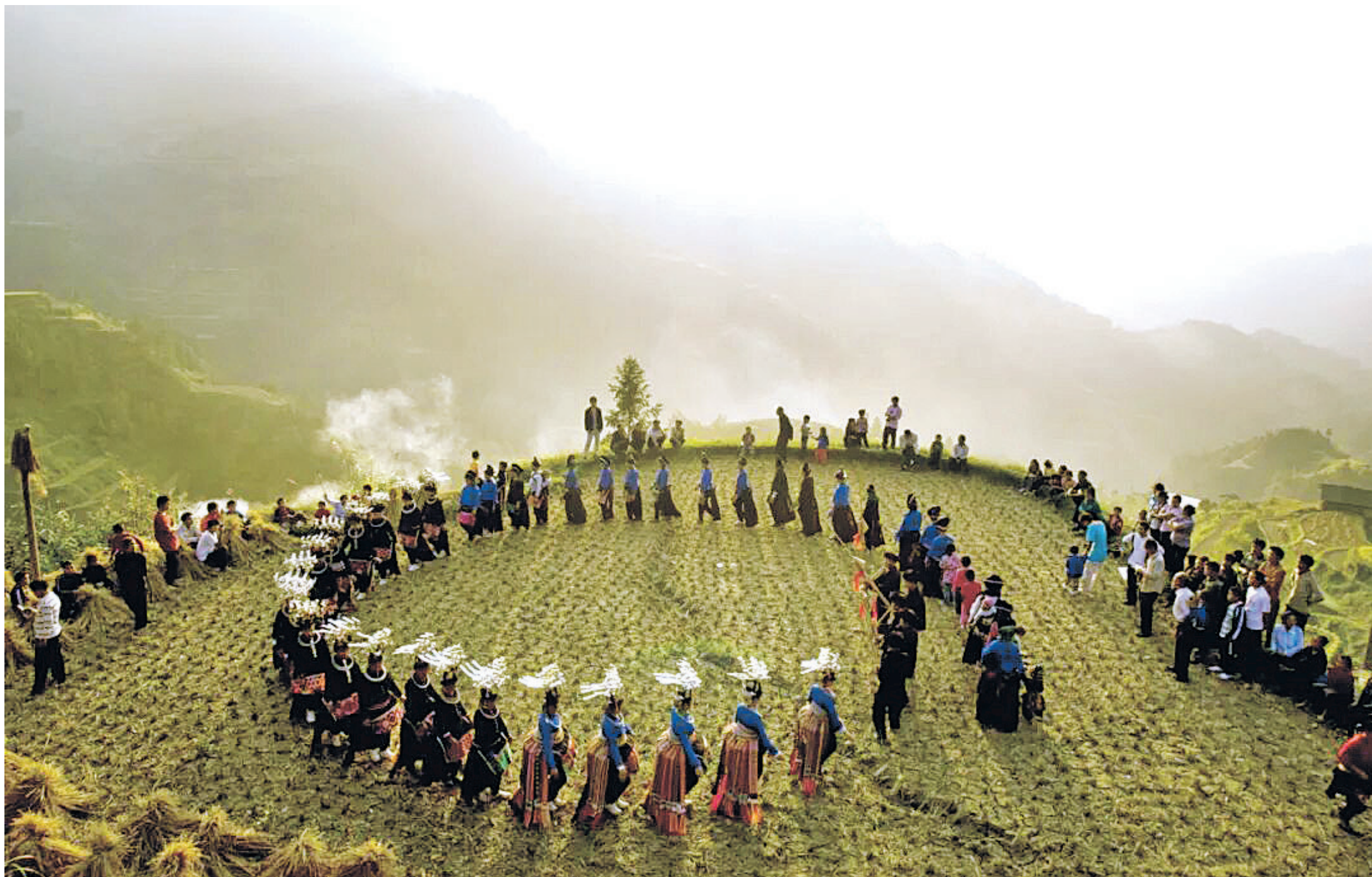
黔东南州丹寨县排调镇麻鸟村锦鸡舞。

■ E-Mail: 402986994@qq.com ■ 电话: 0851-86817231 ■ 责编: 朱雪丹 ■ 一审: 杨文静 ■ 二审: 李冰 ■ 美编: 韦明芳