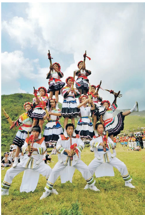
毕节市纳雍县苗族芦笙舞“滚山珠”。本报特约记者 秦刚/摄

技艺“生金”、歌舞“扬名”、节庆“连心”，不同类别的非遗，为贵州村寨插上发展的翅膀，书写着乡村振兴的时代华章。