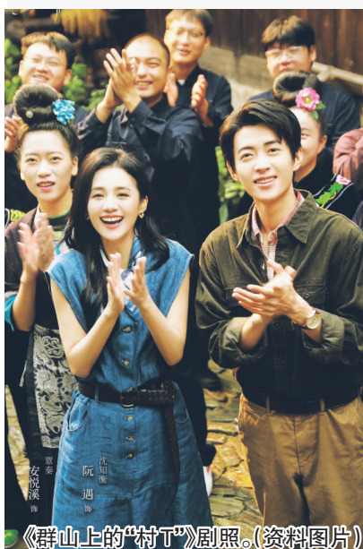
《群山上的“村T”》剧照。(资料图片)

他们, 是一群穿着苗绣盛装的嬢嬢, 在风雨长廊上走秀; 是一位开民宿的侗族姑娘, 在鼓楼边本色出演自己; 是一支由返乡青年组成的乐团, 把侗歌唱成了剧情主线。这些看似不起眼的“素人”面孔, 正成为贵州非遗微短剧最动人的力量来源。