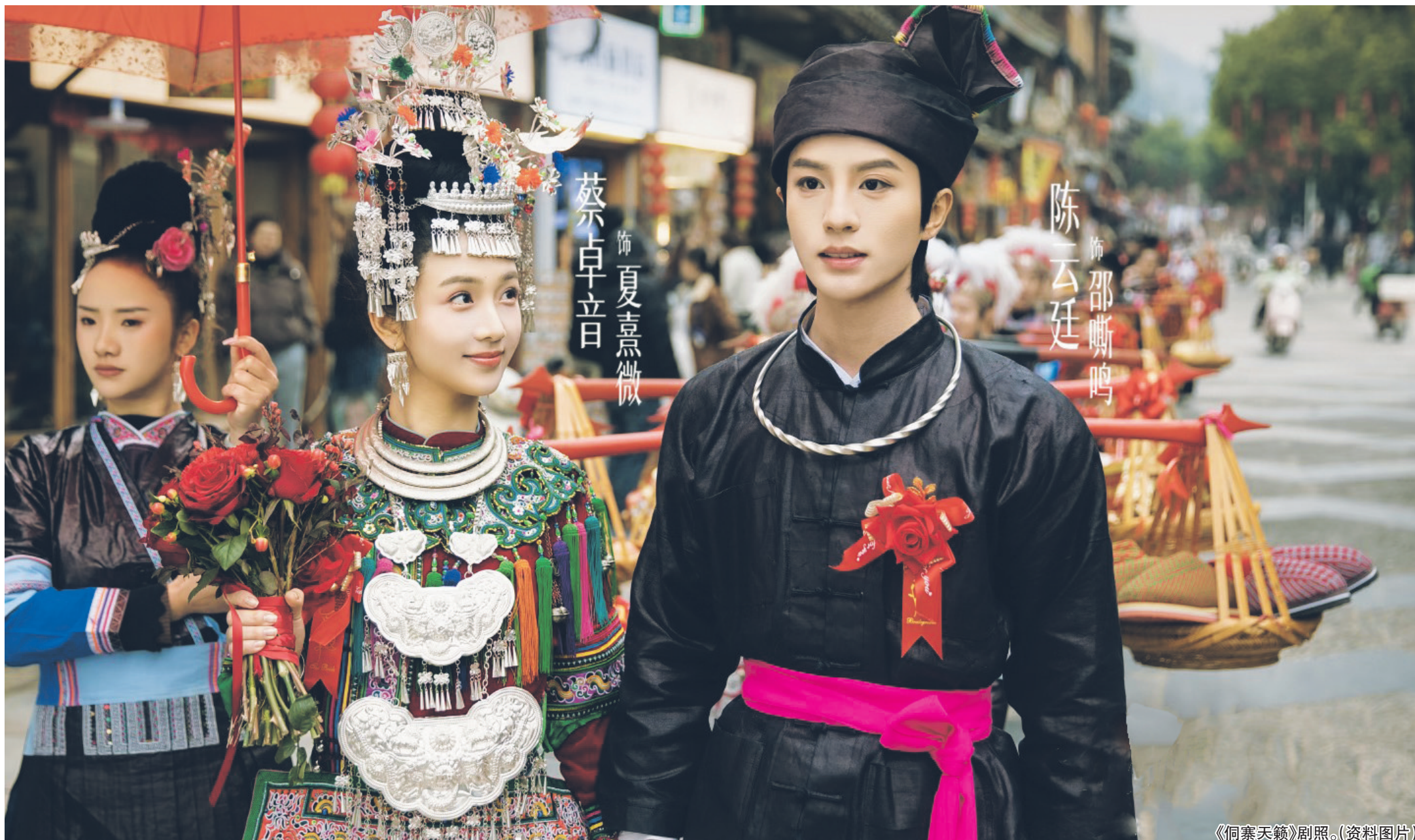
《侗寨天籟》剧照。(资料图片)