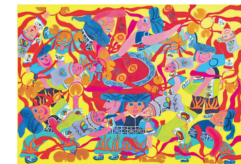
水城农民画。(资料图片)