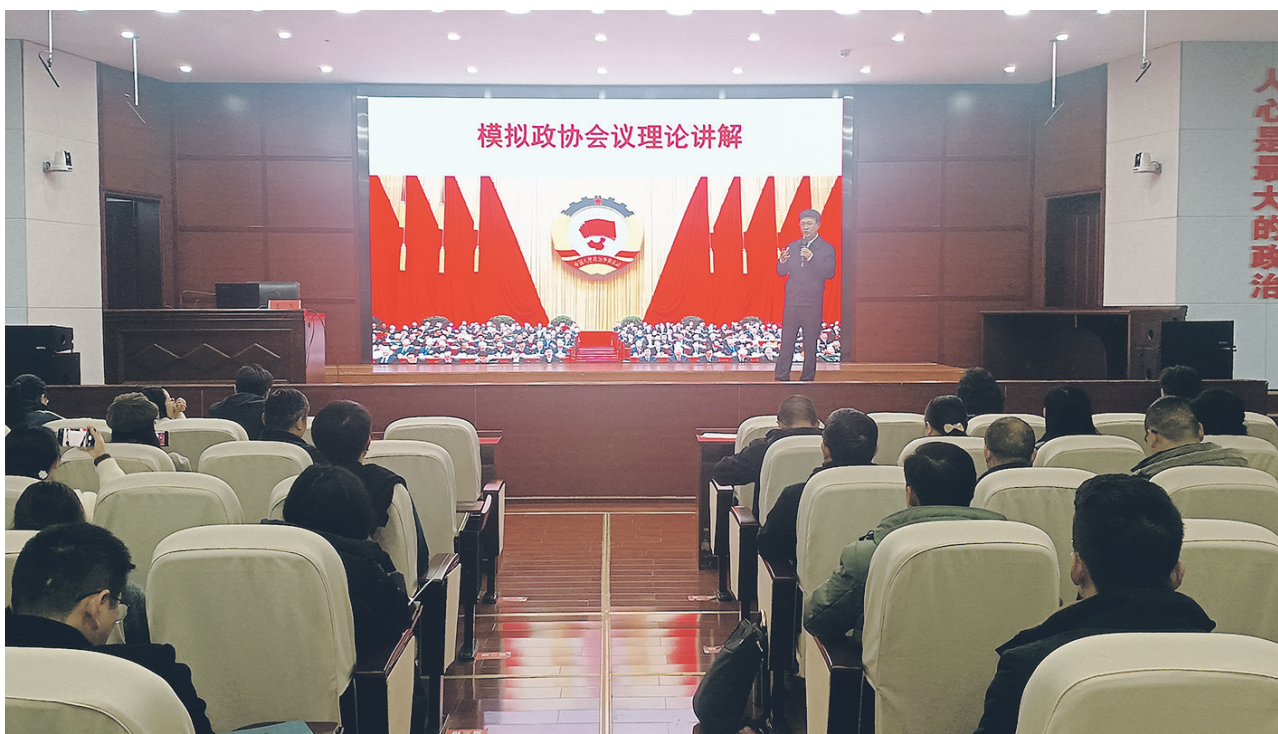
《模拟政协会议》课程是省社会主义学院深化统一战线课程改革重点打造的课程项目。课程通过理论和案例讲解,让学员充分认识中国新型政党制度的优越性和重要作用。(资料图片)