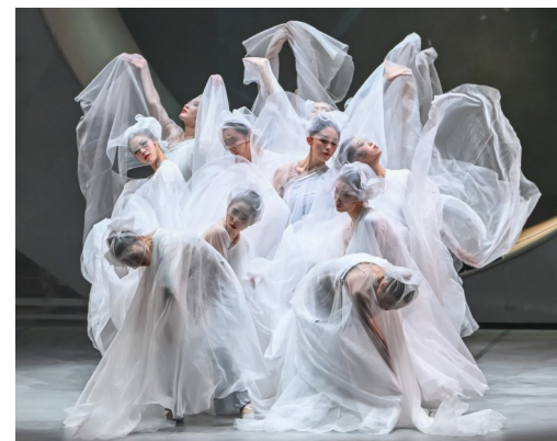
(本版图片均为舞剧《王阳明》剧照)

随即，舞剧《王阳明》即将开启2026年全国巡演。这不仅是一次舞台艺术的巡礼，也是一张文化名片的传播。通过这部作品，更多观众将认识贵州作为“阳明心学诞生地”的文化定位，了解这片土地与一代大儒之间不可分割的联系。