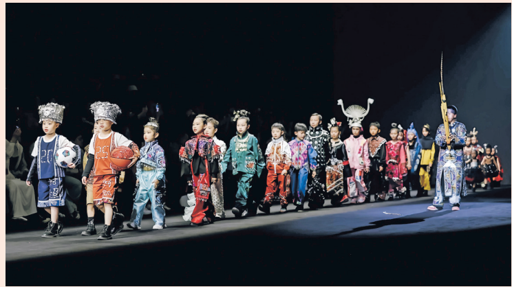
“村T”亮相中国国际时装周。(资料图片)