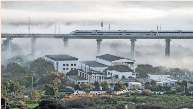
2025年11月28日,盘州至兴义高速铁路正式建成通车。