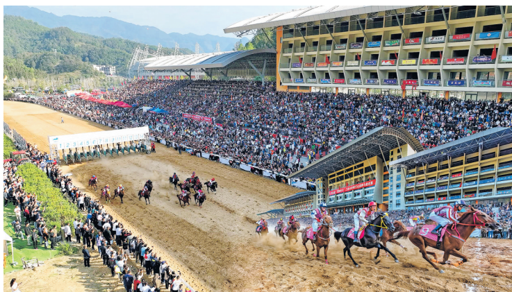
“贵州村马”比赛现场。(资料图片)

2025年,黔南布依族苗族自治州以建设铸牢中华民族共同体意识模范州为总抓手,在深化示范创建、促进交往交流交融、释放政策红利等方面持续发力,统筹推进全州民族团结进步示范创建等重点工作圆满完成,不断书写民族地区高质量发展的“黔南答卷”。