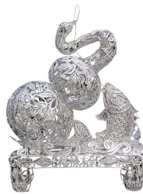
银蛇造型饰件,一般作为银冠或胸饰的装饰部件。