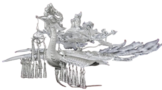
苗族银凤冠(银凤头钗),属于苗族盛装头饰的核心部件。它采用拉丝、掐丝、篆刻等非遗工艺制作。