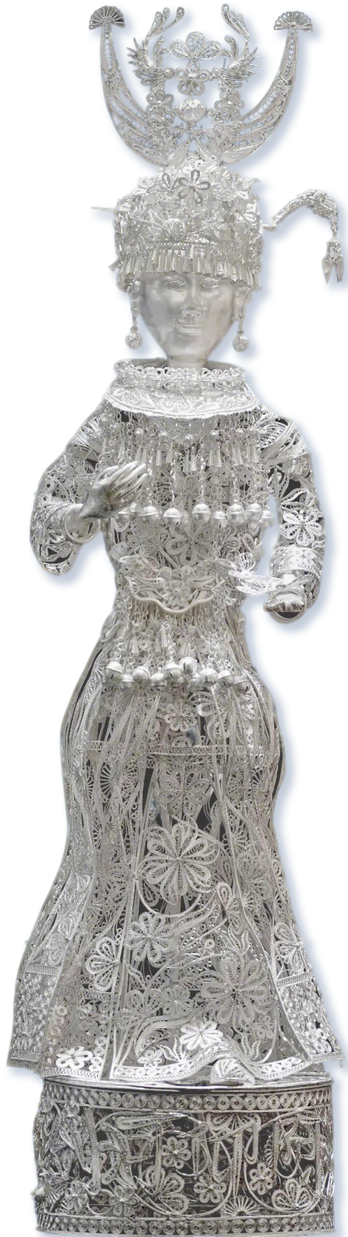
银饰仰阿莎人像摆件。

近年来,苗族银饰银制技艺得到了国家的重视与保护。2006年至2011年间,雷山县、黄平县、台江县、剑河县等地申报的苗族银饰银制技艺项目,相继被列入国家级非物质文化遗产名录,为这一传统技艺的传承与发展注入新活力。