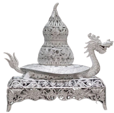
银丝龙龟驮宝摆件,也被称为“玄武驮宝瓶”,采用国家级非遗“银花丝”工艺制作,是兼具装饰性与文化寓意的收藏级银器。

一块璞银入炉,经数十道工序烈火淬炼、千锤万整,终成缀满蝴蝶纹、几何纹的苗家瑰宝——银角流光、银链叠翠,每一道纹路都流淌着千年的迁徙记忆,每一寸光泽都凝着匠人的毕生坚守。作为第一批国家级非物质文化遗产,苗银银制技艺在黔东南苗族侗族自治州雷山、黄平、剑河、台江等县具有深厚的传承基础。