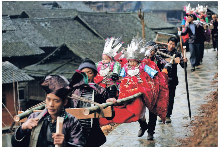
村民抬着“官人”在寨中巡游

村落更是守住了“原生态质感”,邻里互助、诚信友善的古朴民风随处可见。游客走进村里,就能感受到最纯粹的乡村烟火气。