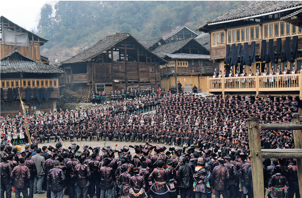
当地群众传唱侗族大歌

2021年起,联合国旅游组织发起“最佳旅游乡村”评选,旨在通过旅游业推动乡村文化传承与经济社会发展。入选案例从文化自然资源、文化资源传承传播、经济和社会可持续性、环境可持续性、旅游潜力与发展等9个方面进行评分。从“藏在深山人未识”的侗寨,到站上世界乡村旅游的舞台,黄岗村凭啥入选?