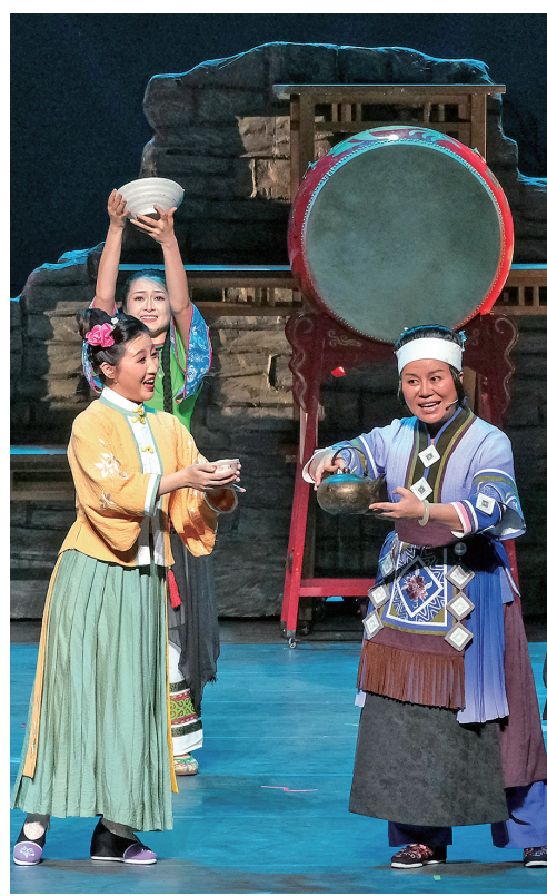
贵州省第八届少数民族文艺会演剧目《山河同心》

广场热闹非凡,“2025 贵州 Z 纪元银河左岸音乐节”在这里火热开唱,随着痛仰、理想后花园、旅行团等乐队先后登场,将现场氛围推向高潮。