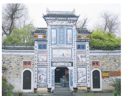
隆里古城风貌

立足“原点”寻求“生长”。按照《贵阳市花溪区石板镇镇山历史文化名村保护规划(2011—2025年)》,镇山村坚持“在发展中保护、在保护中发展”理念,整合资源、统一规划,保护核心区,拓展文化区。