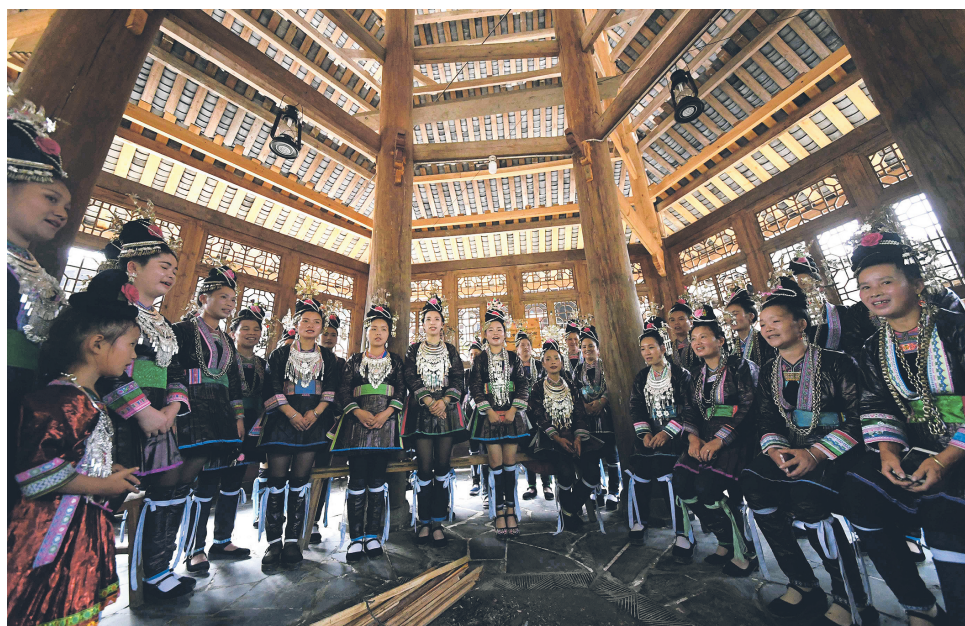
大利侗寨侗族群众在鼓楼里为游客演唱侗族大歌